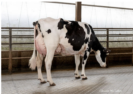
BEYOND HAYK HI-SPEED DAM