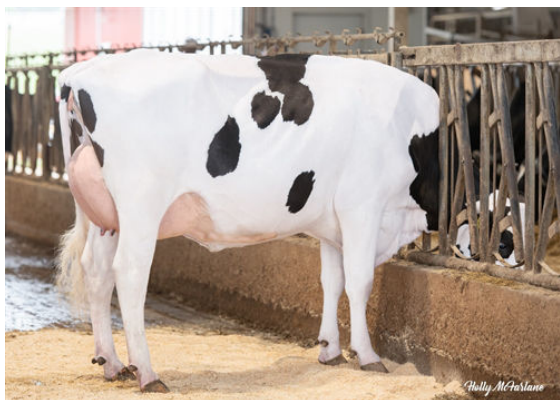
SANDY-VALLEY BORN2BOOGIE GRANDDAM