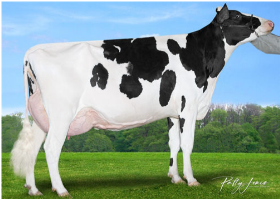
MORNINGVIEW DUKE ZIP FOURTH DAM