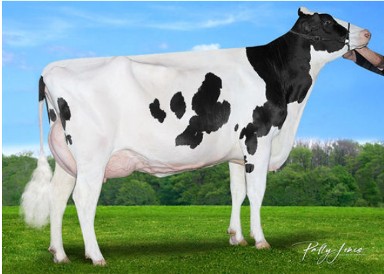
CLAYNOOK ZEETA PURSUIT THIRD DAM