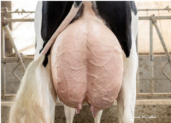
PROGENESIS GAMEDAY TITANIA GRANDDAM