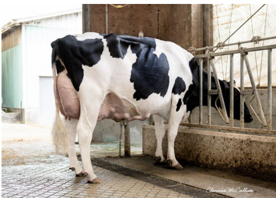
PROGENESIS GAMEDAY TITANIA GRANDDAM