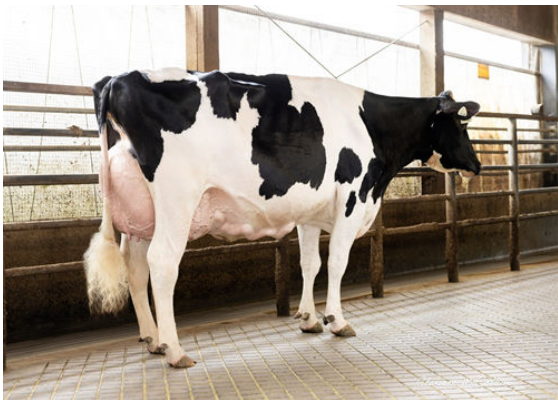
PROGENESIS GAMEDAY TITANIA GRANDDAM