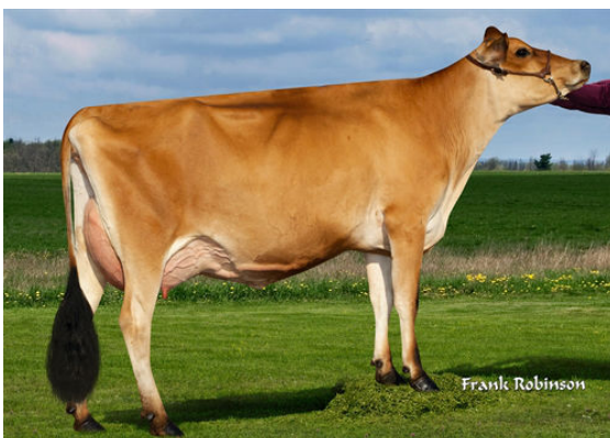
JX VIERRA LADYGAGA {6} DAUGHTER