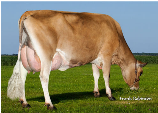
AHLEM SKYLER SKITTLES 56480-P DAUGHTER

DP NXLEVEL DP AXIS MCKENNA 1983 EX-90%-5YR-USA SUGAR GROVE VALENTINO AXIS DP LOUIE MYALEAN 853 EX-90%-4YR-USA TOLLENAARS IMPULS LOUIE 260 DP MECCA MYRTLEAN 9249 EX-90%-4YR-USA