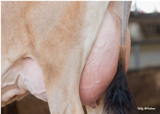
JX PROGENESIS MINNIE {5} DAUGHTER

JX CLOVER PATCH AVON ENZO {3} JX KASH-IN DISCO SEAFOAM {6} OAKLANE DAZZLER DISCO 2127 JX KASH-IN HARRIS 46873 {5} JX SCHULTZ VOLCANO HARRIS {4} KASH IN DIMENSION 39452-P EX-90%-3YR-USA