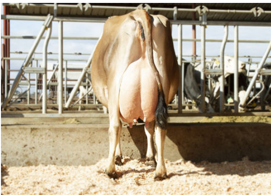
SHJ LISTOWEL MACKENZIE