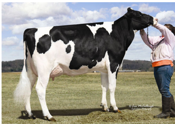
STRAUSSDALE PLANET ELLA