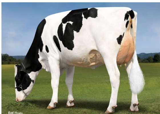
PROGENESIS DUKE MOLDAVITE GRANDDAM