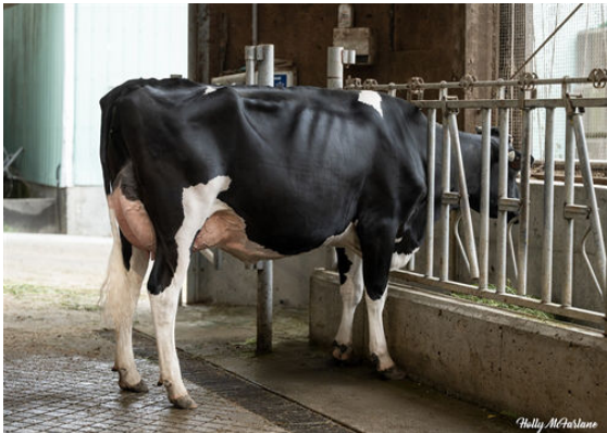
WESTCOAST EARLYBIRD RIZA DAUGHTER