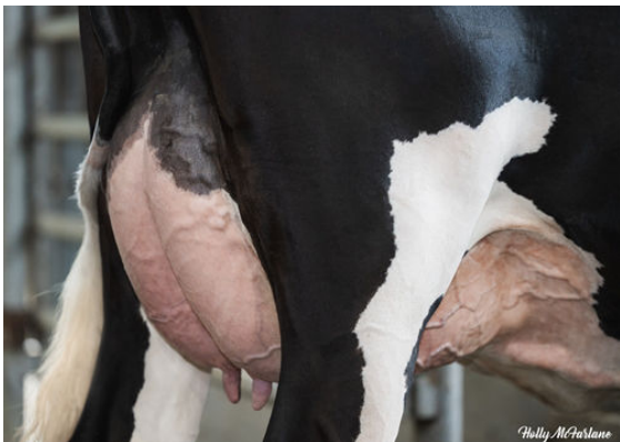
WESTCOAST EARLYBIRD RIZA DAUGHTER