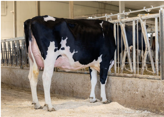
HOLYLAND EARLYBIRD SUNSHINE DAUGHTER