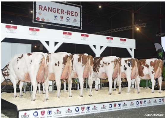
RANGER-RED DAUGHTER GROUP HHH SHOW, NETHERLANDS