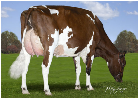
H-BRIDGE RANGER DENISE RAE RED DAUGHTER