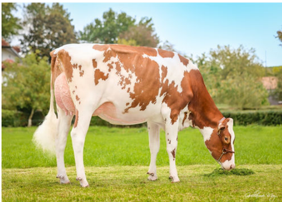
B.O.A. RANGER CARAMBA DAUGHTER