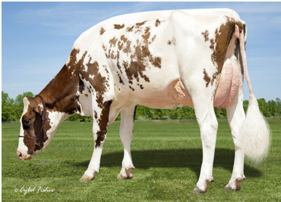
FARNEAR ROXY-RED DAM