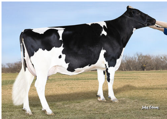
ROYLANE SHOT MINDY 2079 FIFTH DAM