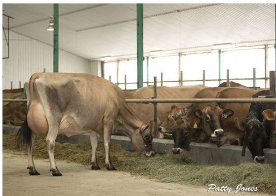
LENCREST COCOPUFF DAM

RIVER VALLEY JOYRIDE LENCREST COCOPUFF EX-93-2E-CAN 4* ISDK GOLDEN GDK VIVALDI LENCREST PREMIER COCO EX-92-2E-CAN 4* HAWARDEN IMPULS PREMIER SELECT -SCOTT SALTY COCOCHANNEL EX-94-2E-CAN 4*