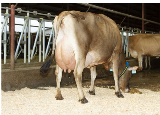
RACHELLES VICEROY LOUISE FOURTH DAM