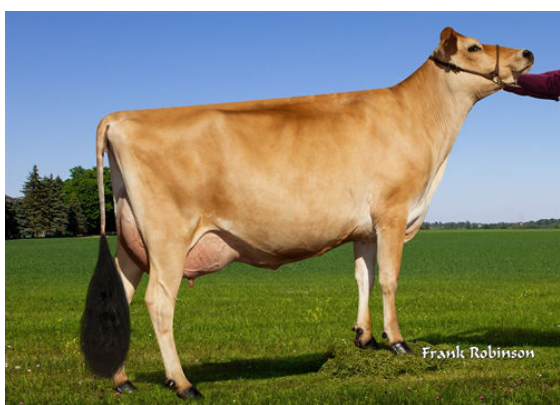
PROGENESIS MADISON- THIRD DAM