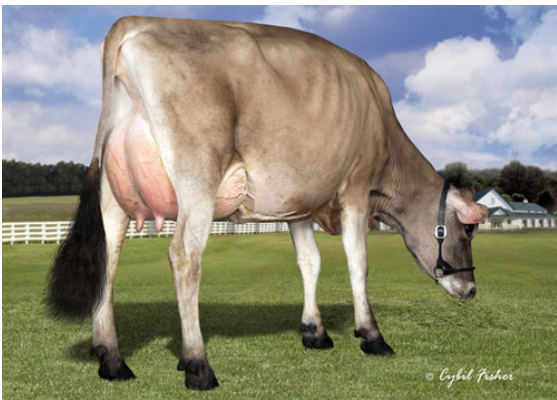
JER-Z-BOYZ MACNCHEZ 48947 FOURTH DAM