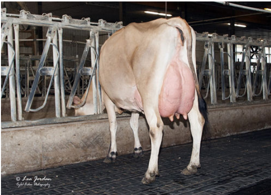
RIVER VALLEY LSTWL MACNCHEZ 5055 THIRD DAM