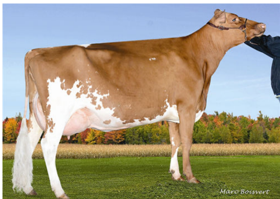
MARBRAE MACKENNA FOURTH DAM