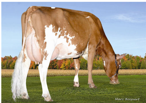
MARBRAE MACKENNA FOURTH DAM