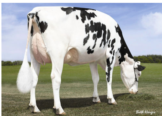
MS C-HAVEN OMAN KOOL