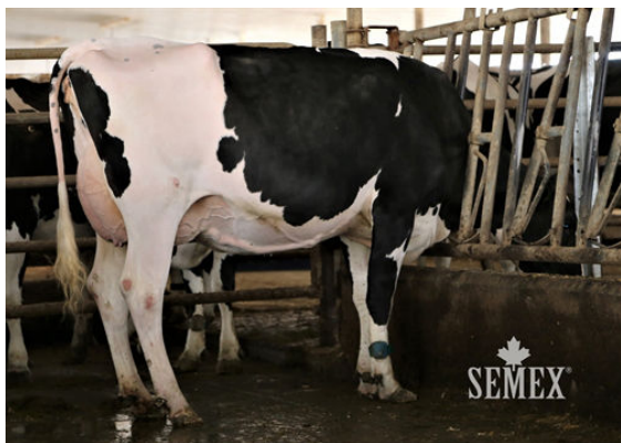
PELLERAT KANE FALBALA