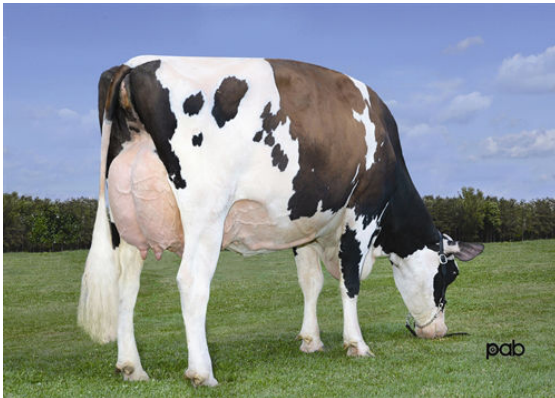
KHW-I AIKA BAXTER Granddam