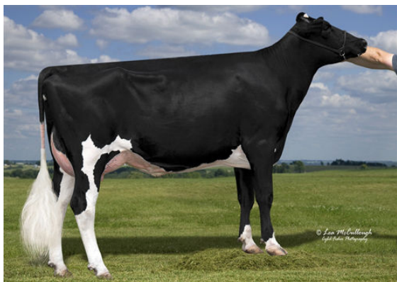
LEXVOLD HUNGER GRACE