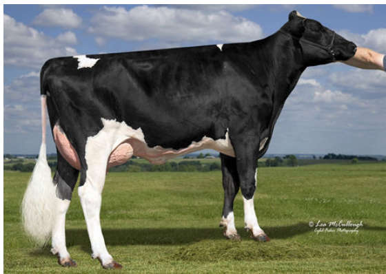
LEXVOLD HUNGER GINNY