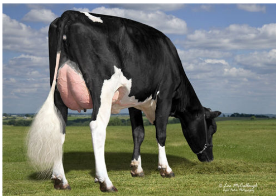
LEXVOLD HUNGER GINNY