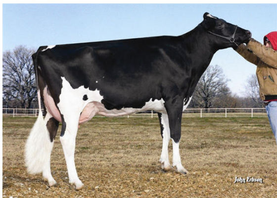
MORNINGVIEW PRONTO C-RAE Granddam