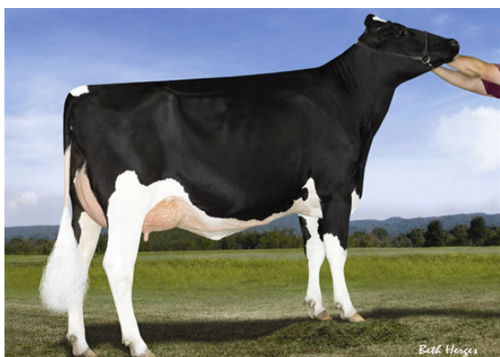
PINE-TREE 1258 MITY 4771