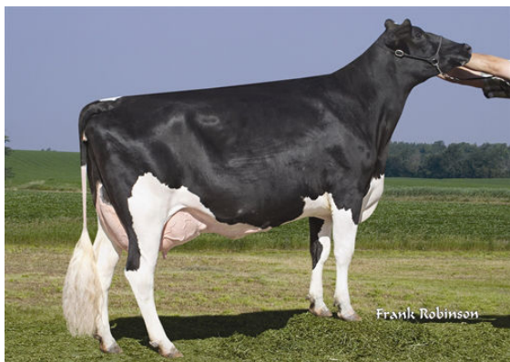
RI-VAL-RE GOLDWYN NADINE FIFTH DAM