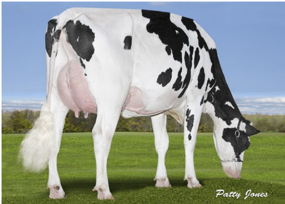
CALBRETT PBALL SUNNY DAY P DAM