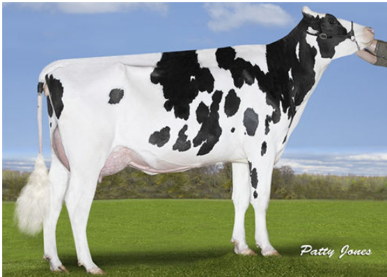
CALBRETT PBALL SUNNY DAY P DAM