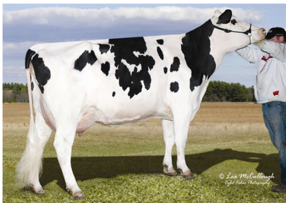
GLO-CREST O MAN PIRATE 4092 FIFTH DAM