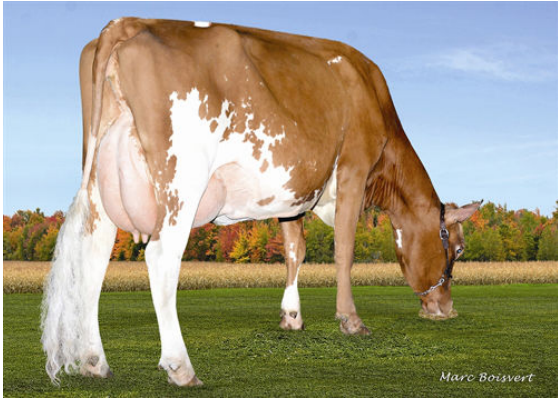
MARBRAE MACKENNA FOURTH DAM