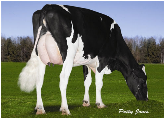
NEVERIDLE GOULET 401