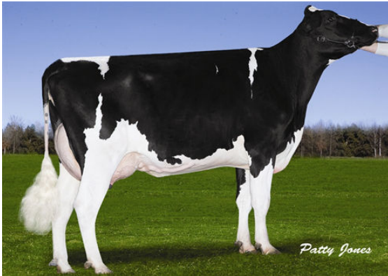
NEVERIDLE GOULET 401