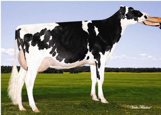
CAROLYNE ADVANCE BALSA