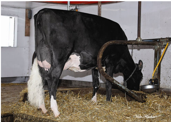
BARTHEMOI ADVANCE JULIA