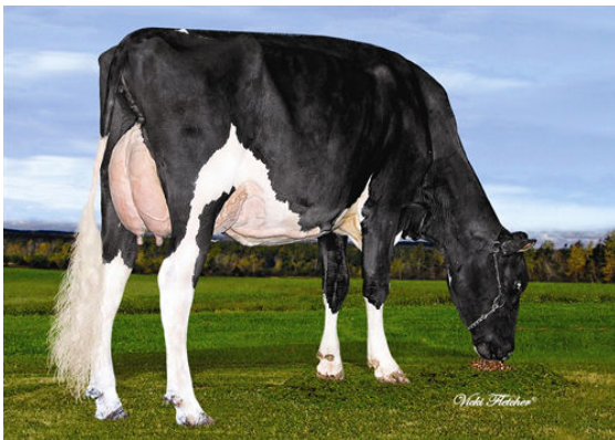
BERNI ADVANCE ZARTA