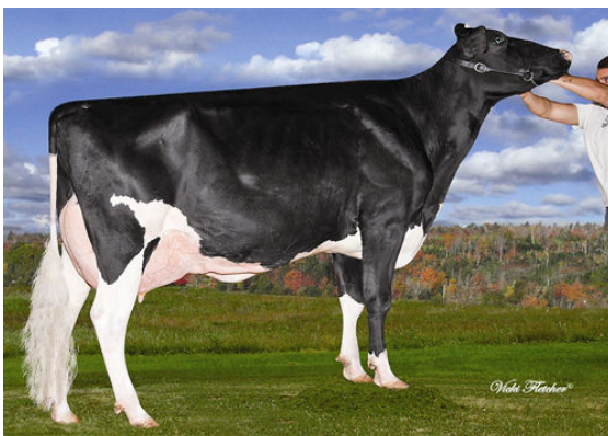
AMITIES GOLDWYN LOVER