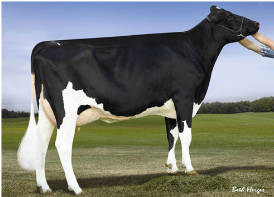
FUSTEAD ARMITAGE SELAH DAM