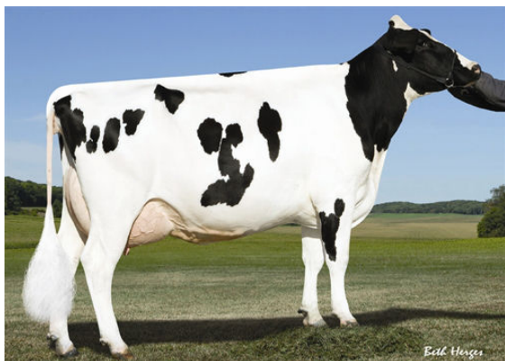
PINE-TREE MONICA PLANETA GRANDDAM