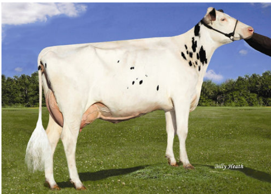
RICHMOND-FD BARBIE THIRD DAM