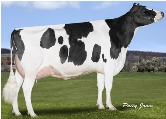
SONRAY-ACRES SOC OBSERV VI FOURTH DAM