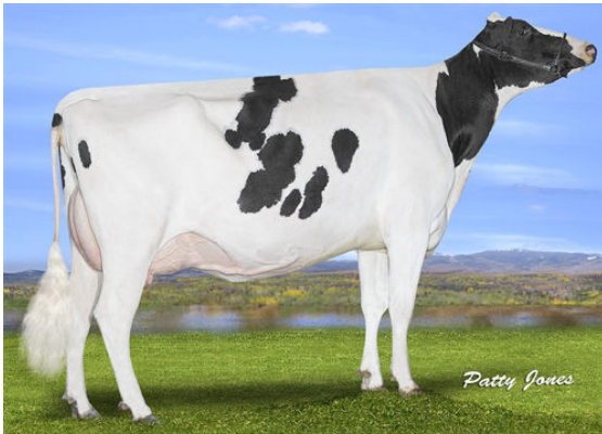
PROGENESIS BAYONET THRUST GRANDDAM