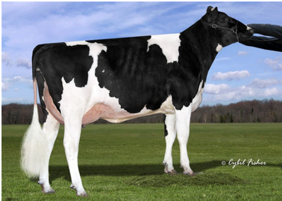
SIEMERS DENVER PARIS GRANDDAM