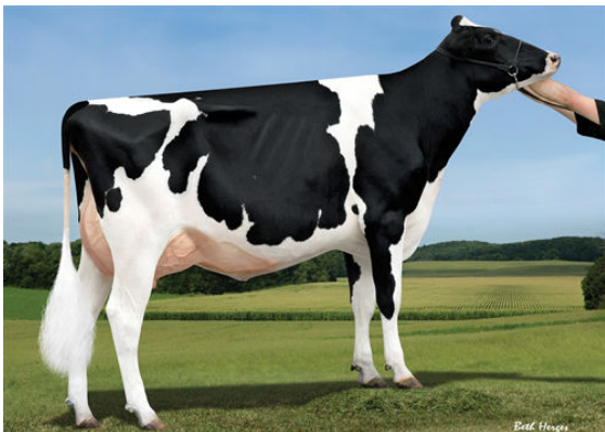
SANDY-VALLEY BL PARADISE FIFTH DAM