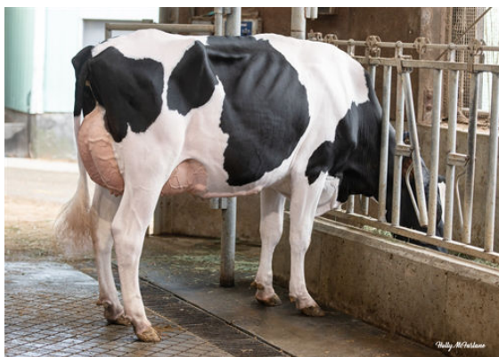
PROGENESIS MAGNIFIQUE PROUD DAM