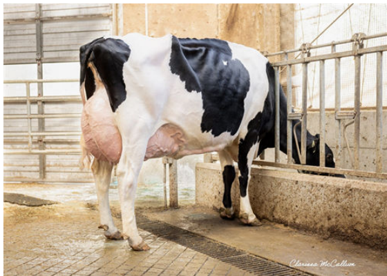
PROGENESIS ZAZZLE PRESTIGE GRANDDAM