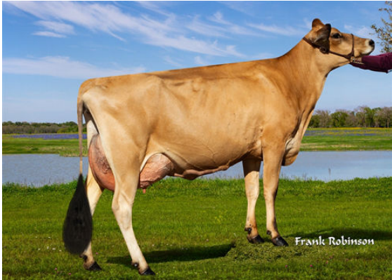
JX LUCKY HILL WILDFLOWER {6}

LUCKY HILL BALLISTIC WINNIE VG-85%-3YR-USA