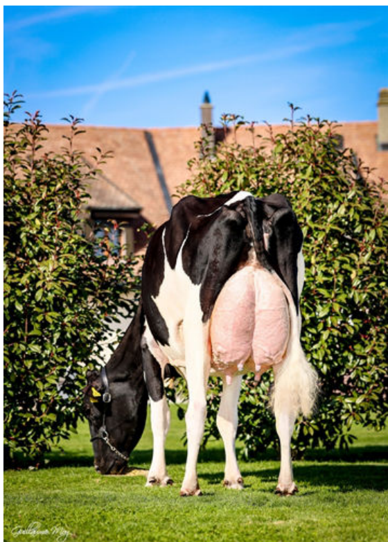
VOGUE A2P2 HIPITI SG