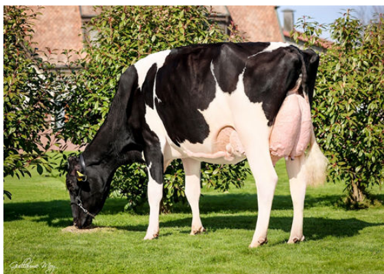
VOGUE A2P2 HIPITI SG