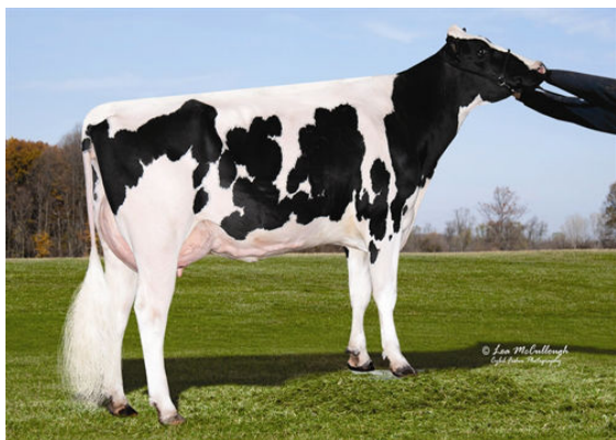
O-BEE KRUSADER INGRID