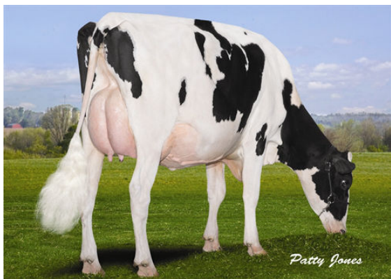
CHANMAR KRUSADER SPIKE