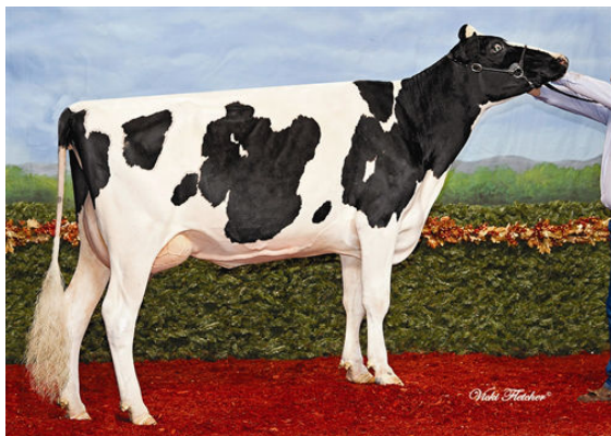
BELFAST KRUSADER LAVENDER