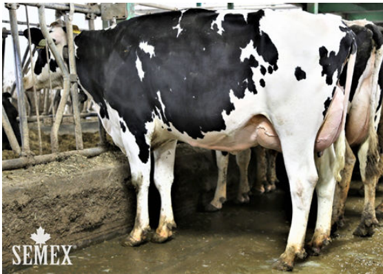
BERNI SUPERMAN DIVA