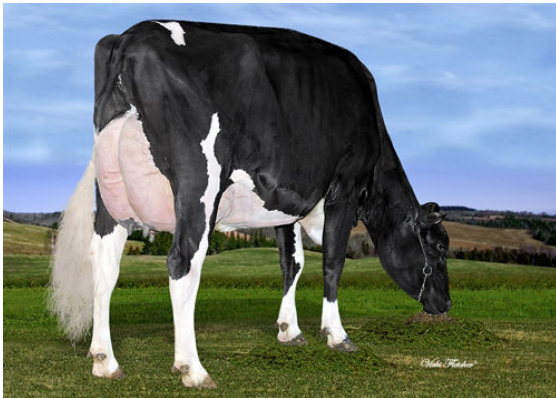
LINDENRIGHT SUPERMAN MOOLA