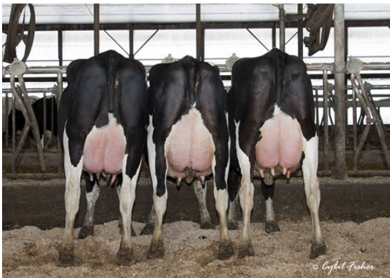
SUPERMAN DAUGHTER GROUP

L-R CURTIN SUPERMAN 20220, CURTIN SUPERMAN 20048, CURTIN SUPERMAN 20219