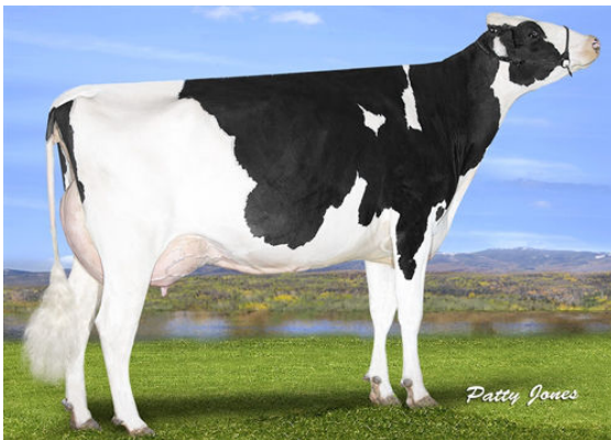
OCD DELTA MISSY GRANDDAM