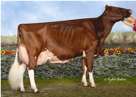
KHW REGIMENT APPLE-RED THIRD DAM