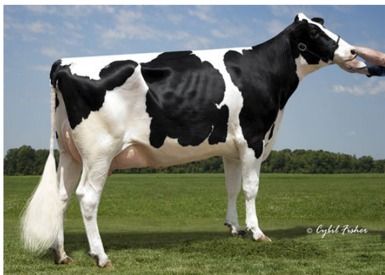
EDG RUBY UNO RAE 2054 FOURTH DAM