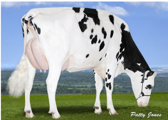
PEAK BOMBERO MAXIMA FOURTH DAM