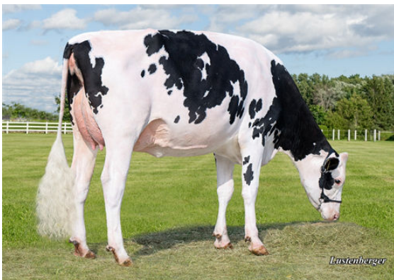
THUHO TARMAC VAIANA DAUGHTER