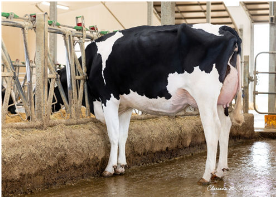
WALNUTLAWN PG TARMAC BRAVO DAUGHTER