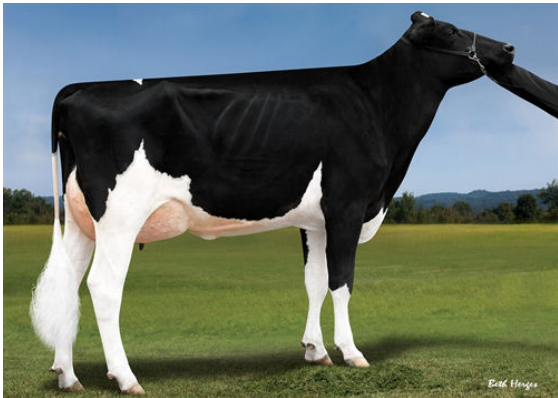
PROGENESIS MONTANA GALATEA FOURTH DAM