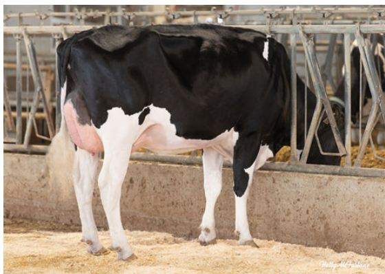
PROGENESIS RANGER LENNON