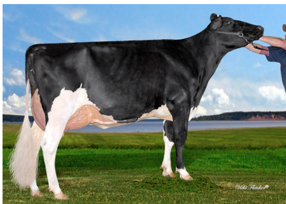
JACOBS UNIX BRILLANT GRANDDAM